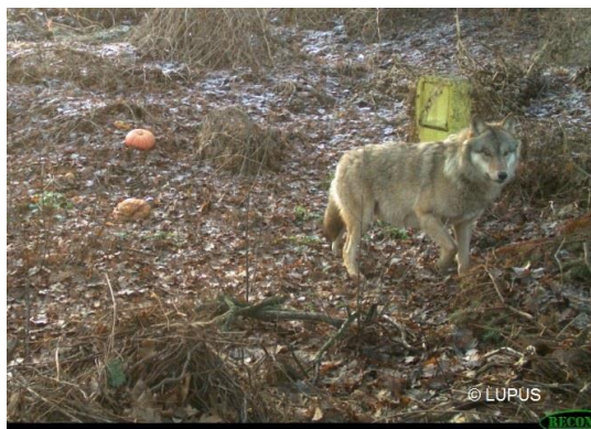
Abb. 2. Jährlingsrüde aus dem Ruzow Rudel hält sich seit November 2016 bei Rietschen auf und sucht im Siedlungsbereich nach Futter, z.B. an Komposthaufen.

Siedlungsnähe zu entsorgen, um dem Tier nicht weiter Anreiz zu bieten, im Siedlungsbereich